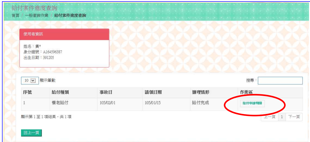
【圖 5-3】給付案件進度查詢結果畫面

4.點選作業區 給付申請明細 按鈕，依據給付種類顯示其【OO 給付進度查詢明細表】《系統預設為個人資料遮蔽》。