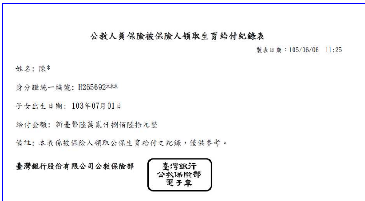
【表 31】生育給付紀錄表