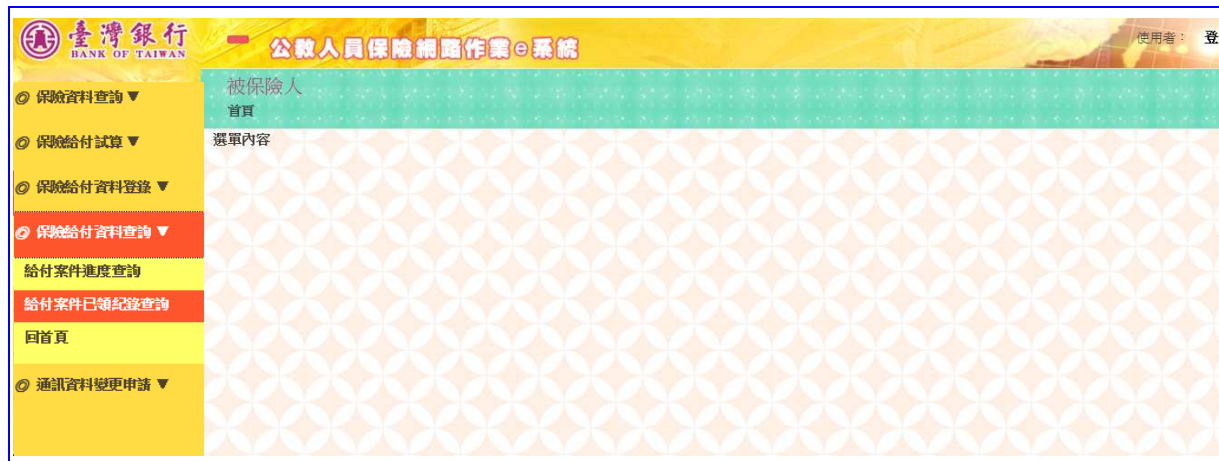
【圖 5-4】給付案件已領紀錄查詢畫面

登入系統首頁→展開保險給付資料查詢選單→點選給付案件已領紀錄查詢按鈕→進入給付案件已領紀錄查詢輸入畫面。