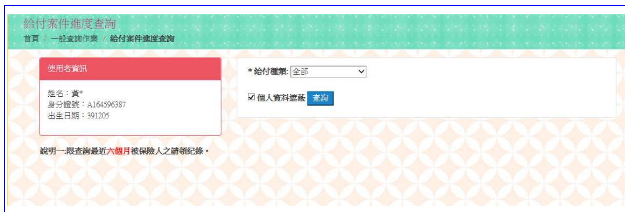
【圖 5-2】給付案件進度查詢輸入畫面