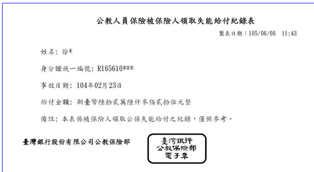
【表 33】失能給付紀錄表