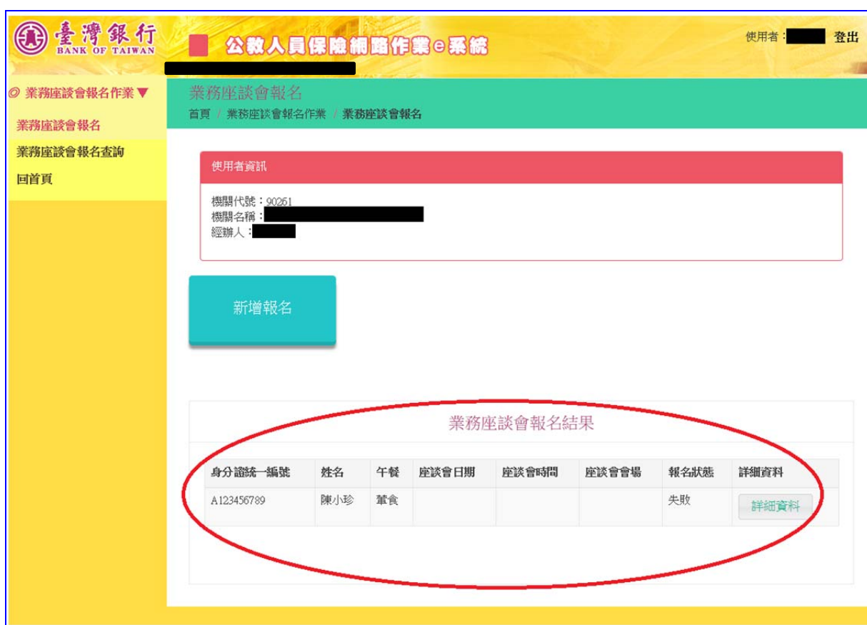
【圖 7-4】業務座談會報名結果畫面