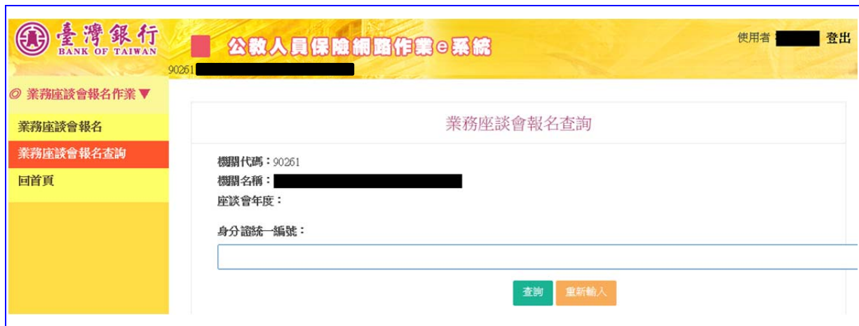
【圖 7-6】業務座談會報名查詢畫面

報名完成之後，如欲查詢已報名結果，可由左側選單選取「業務座談會報名查詢」，輸入身分證統一編號後，點選「查詢」，即可查詢報名結果。