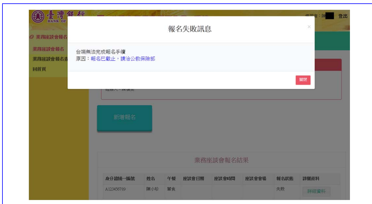
【圖 7-5】業務座談會報名詳細資料