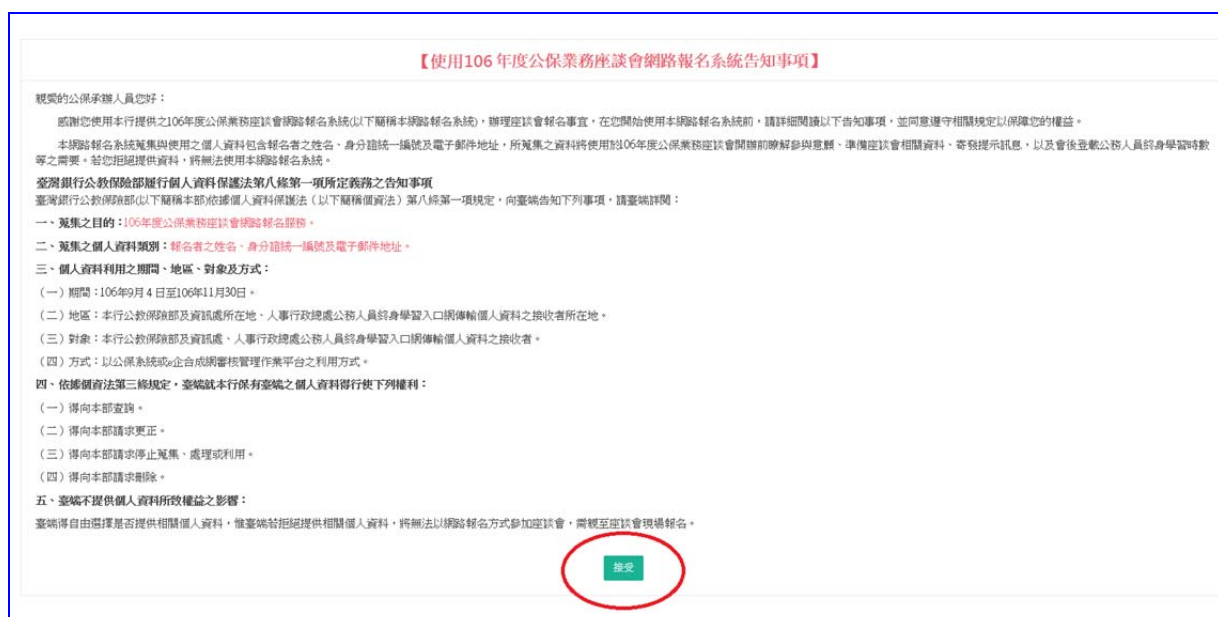
【圖 7-2】業務座談會網路報名系統告知事項