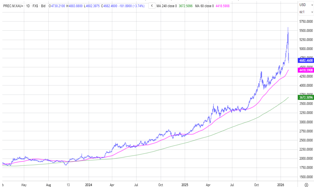
附圖 2：本行黃金存摺價格走勢圖(3 年期)：(單位 NT$/g)