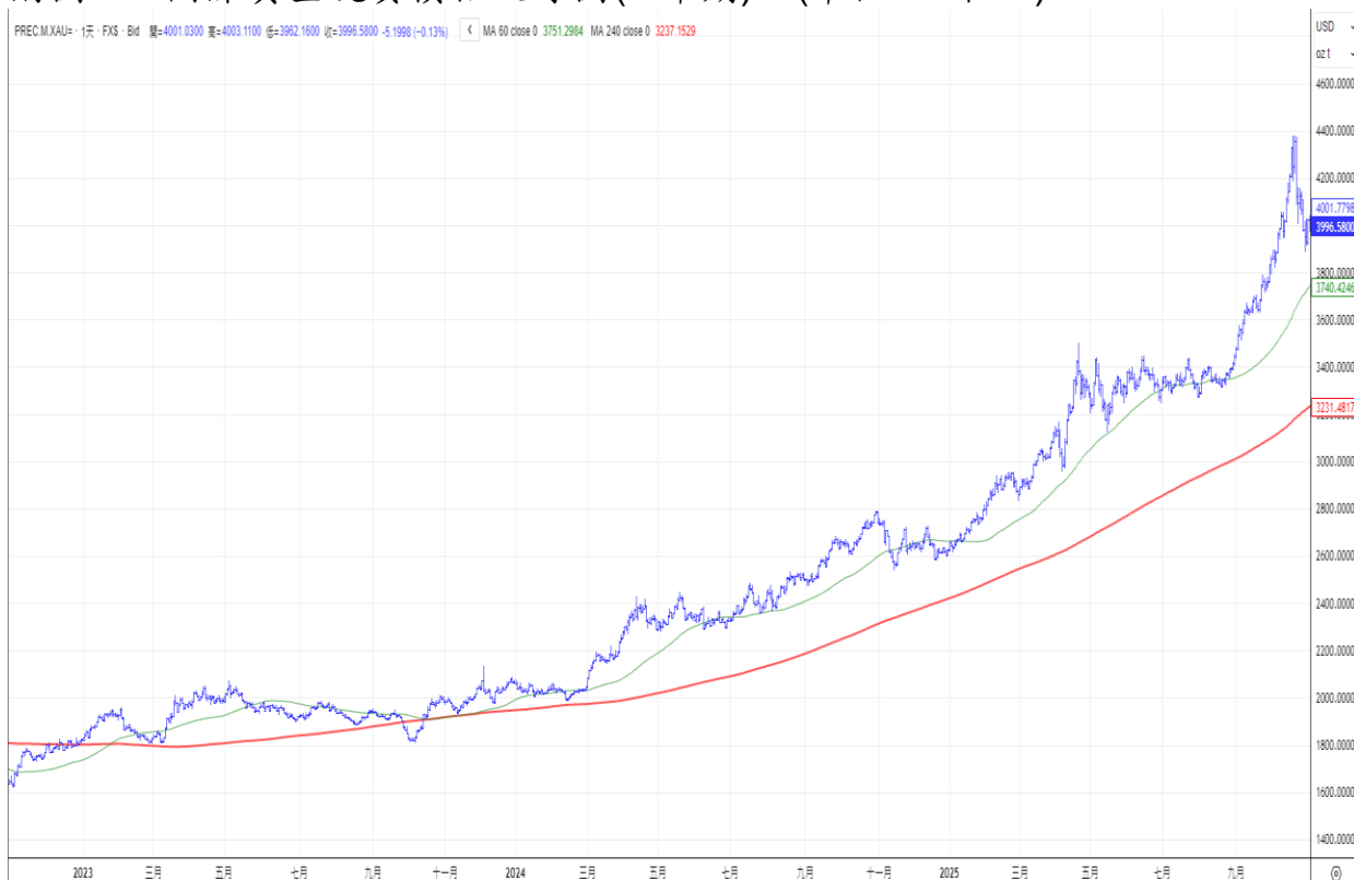
附圖 2：本行黃金存摺價格走勢圖(3 年期)：(單位 NT$/g)