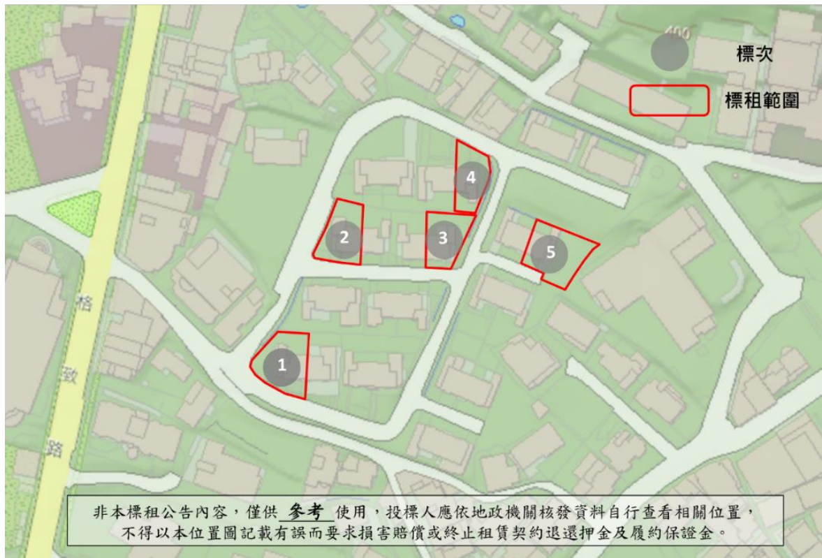
坐落位置示意略圖